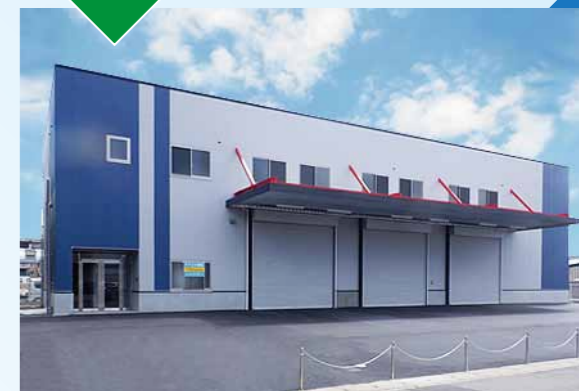
令和5年4月 京都市伏見区田中殿町 倉庫付事務所新築工事