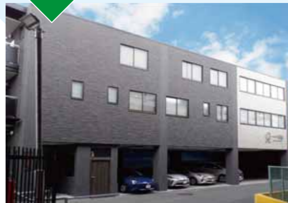
令和3年12月 大阪府豊中市 株式会社 利昌 本社リノベーション工事