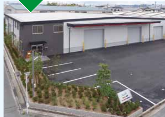
令和3年6月 大阪府摂津市 株式会社 濱田カンパニー 事務所付倉庫新築工事