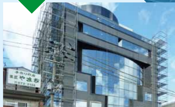
令和元年10月 大阪府大東市 住道グランドビル 外壁防水工事