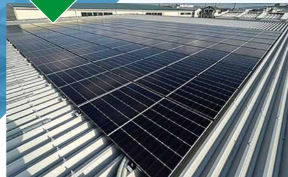
令和5年1月 大阪府摂津市 (株)翔樹 本社太陽光・蓄電システム設備工事 (40KW相当設置)