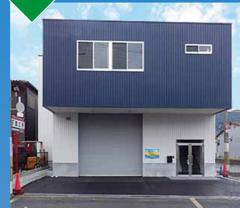
令和6年4月 大阪府守口市 (株)ホームギャラリー 事務所付倉庫新築工事